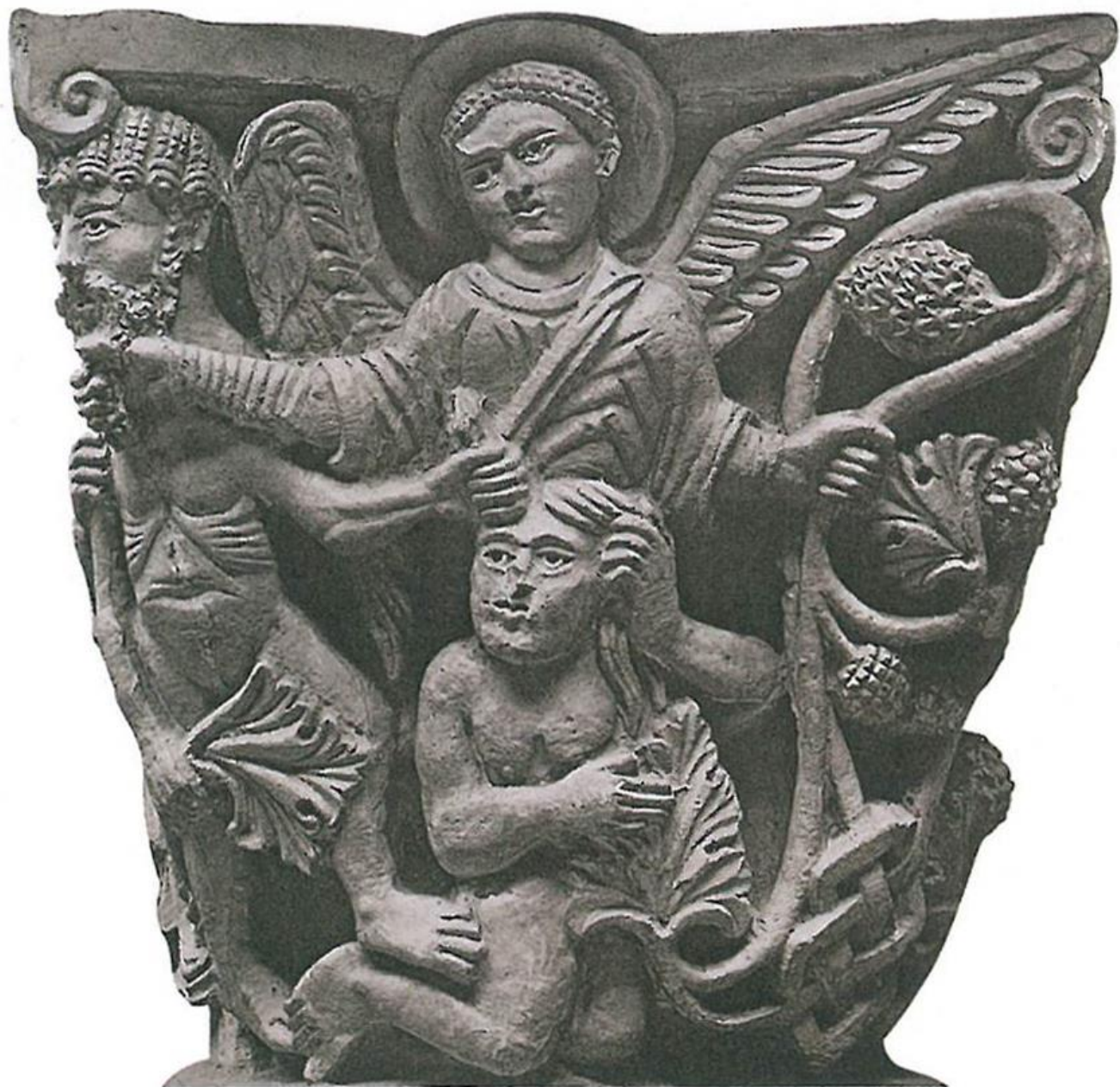
4. Capitello nella cattedrale di Clermont-Ferrand.