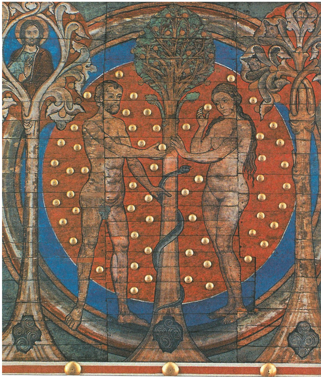
2. Dipinto sulla volta della Klosterkirche St Michael, Hildesheim.