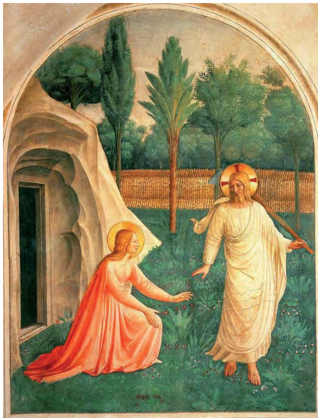
figura 3 : Beato Angelico, Noli me tangere , affresco, ca. 1438-1440, Convento di San Marco, Firenze.

Si è detto del passato; manca ancora l'idea di futuro. Per completare il discorso, riprendiamo l'analisi di Didi-Huberman, il quale rileva che nel giardino dell' Annunciazione sono sbocciati molti fiori: fiori bianchi e rossi che ricorrono anche in un altro giardino, quello in cui è situato l'episodio del Noli me tangere ( figura 3 ), che conclude la vicenda terrena di Cristo, iniziata al momento dell'Incarnazione.