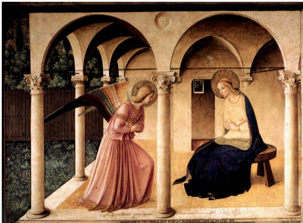
figura 1: Beato Angelico, Annunciazione del corridoio nord , affresco, ca. 1440-1450, Convento di San Marco, Firenze