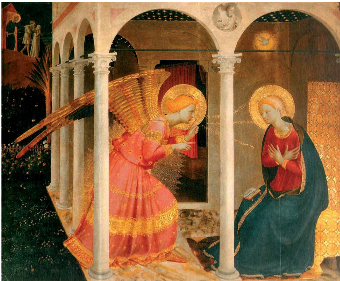
figura 2: Beato Angelico, Annunciazione di Cortona , 1430 circa, tempera su tavola, Museo Diocesano di Cortona.