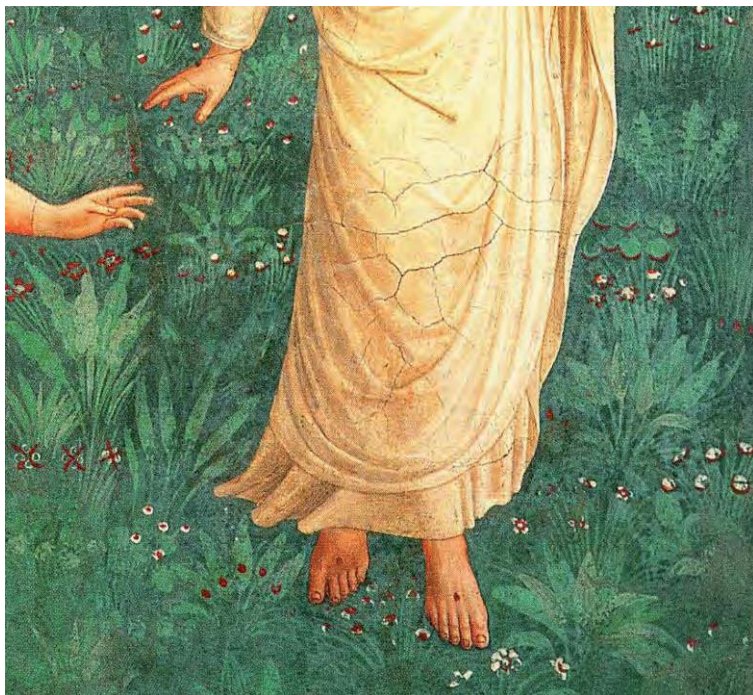
figura 4: Beato Angelico, Noli me tangere , particolare.